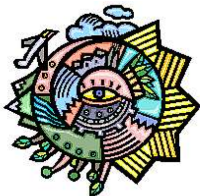
Agenda 21 Est Ticino per lo sviluppo sostenibile