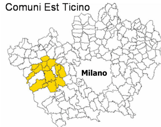
Comuni Est Ticino

I MEZZI: Partecipazione Integrazione delle politiche Misurabilità delle esperienze